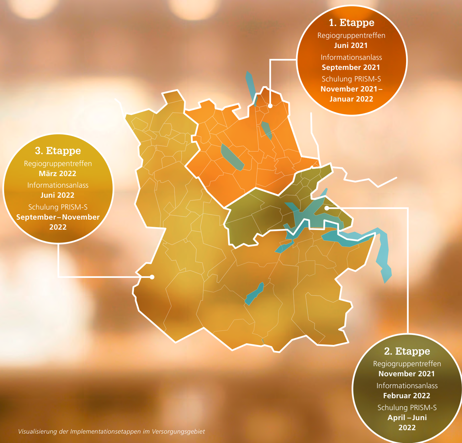
Visualisierung der Implementationsetappen im Versorgungsgebiet

lassene Psychotherapeutinnen und -therapeuten, Fachpersonen Psychiatrie-Spitex, selbstständig tätige ambulant-psychiatrische Pflegefachpersonen, Hausärztinnen und -ärzte, somatische Spitäler und Mitarbeitende der lups statt. Fachpersonen können die SERO-Massnahmen in ihrem Arbeitsalltag anwenden und ihr Netzwerk, wie zum Beispiel weitere Kolleginnen und Kollegen und Fachgremien, darüber informieren.